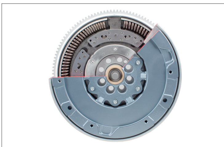
Figura 1: Volano a doppia massa con pendolo centrifugo

In fase di montaggio del volano a doppia massa, i pendoli centrifughi si muovono liberamente all'interno. I rumori che ne risultano sono normali e indicano esclusivamente il perfetto funzionamento delle masse dei pendoli.