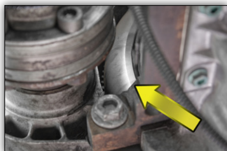
Image 3 : Une fois le couvercle retiré, on peut apercevoir les points de distinction.

Les points de distinction des deux volants bimasse sont visibles sur les images 4 à 7. Lorsque ces derniers sont montés, il est possible de voir les caractéristiques distinctes à travers le hublot (trappe de visite) de la cloche d'embrayage (voir image 3).