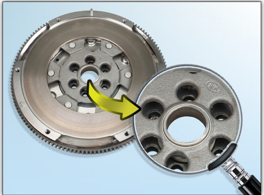
Image 1 : Volant bimasse LuK 415 0059 10 avec palier lisse

Les véhicules cités plus haut peuvent être équipés d'un volant bimasse LuK ou Sachs. Ces deux volants bimasse se distinguent l'un de l'autre par leur conception mais ils ne sont pas évidents à différencier.