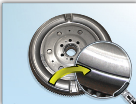
Image 6 : Côté moteur avec rainure périphérique sur le volant bimasse LuK