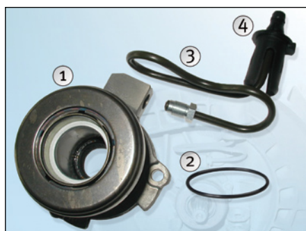
Fig. 1: Desmontar las piezas y eliminarlas

Debe tenerse en cuenta que la versión del CSC montado en el vehículo puede ser diferente al CSC de LuK con nº de artículo 510 0073 10. En este caso, el sistema de desembrague debe "reajustarse".