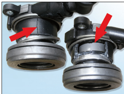
Fig. 5: Cojinete hidráulico dañado por una instalación errónea

Tras la sustitución del cojinete hidráulico es necesario purgar el sistema. El proceso de purga se divide en dos pasos. Por una parte, se purga el accionamiento del embrague, por la otra, se purga el cojinete hidráulico.