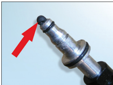
Fig. 4: Si no se ha retirado el anillo de obturación anterior, se presionará hacia el CSC atascando el conducto