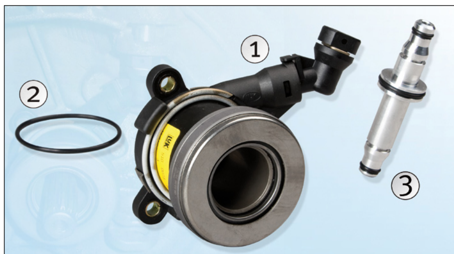
Fig. 2: LuK CSC 510 0073 10

El cojinete hidráulico, abreviado a CSC (del inglés Concentric Slave Cylinder) está expuesto, al igual que el embrague y el volante motor al desgaste natural, por lo que debería sustituirse cada vez que se cambie el embrague.