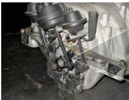
Картина повреждения: поломка в системе тяг и рычагов переключения