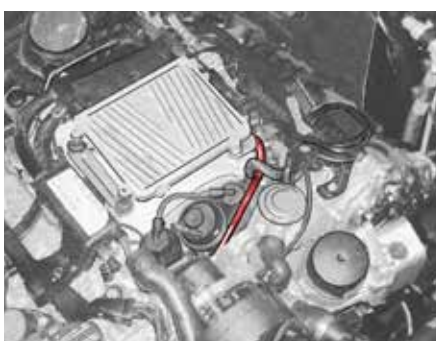
Моторное отделение W211 с трубопроводом системы вентиляции картера двигателя (выделен)