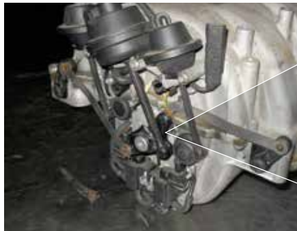
Manifestación de la avería: rotura en el varillaje de mando