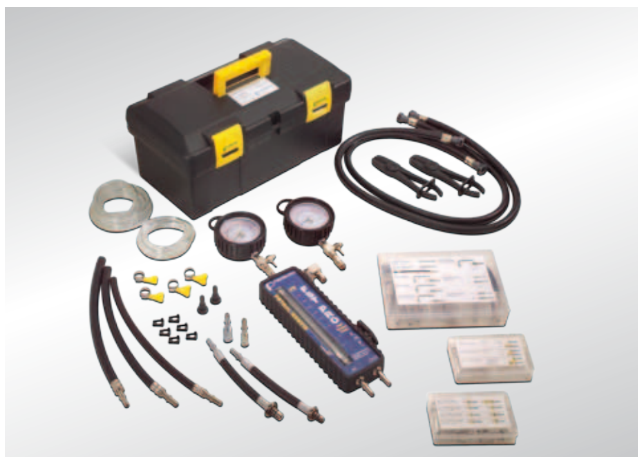
Maletín de comprobación de la presión del combustible