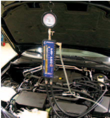
Aplicación en el vehículo

Normalmente, el equipo de comprobación se conecta directamente a la corriente de combustible. Un lugar de montaje elegido a lo largo de la tubería de alimentación de combustible y cercano al distribuidor de combustible permite, por ejemplo, una