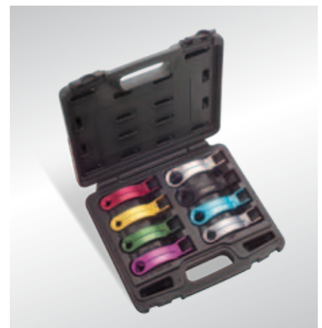
Juego de herramientas para el maletín de comprobación de la presión del combustible

Juego de herramientas para el maletín de comprobación de la presión del combustible (4.07373.21.0), para abrir acoplamientos rápidos (Quick Connectors)