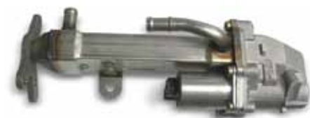
Rys. 1: zawór EGR z chłodnicą EGR

Od momentu wprowadzenia normy spalinowej Euro 4 coraz częściej stosowane są systemy EGR z chłodnicami EGR (patrz również PIERBURG Service Information SI 0108). Chłodnice EGR nie są typowymi częściami zużywalnymi. Mimo to w okresie ich użytkowania silnika może dojść do awarii chłodnicy EGR.