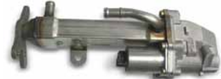
Рис. 1: клапан системы EGR с радиатором системы EGR

При использовании радиаторов системы EGR охлаждающее средство двигателя выступает в качестве охлаждающей среды. Радиаторы изготавливают из высококачественной стали или алюминия. При неблагоприятных или непредвиденных условиях эксплуатации (например, при работе двигателя на топливе с очень высоким содержанием серы или биотопливе) возможно усиление образования агрессивных продуктов сгорания. С течением времени это может привести к внутренней негерметичности, которая в свою очередь вызывает постепенную потерю охлаждающего средства. В поиске причины потери жидкости часто ошибочно и безуспешно заменяют уплотнения головки блока цилиндров, головки блоков цилиндров или же уплотнения мокрых гильз цилиндров.