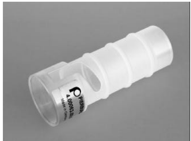
Werkzeug Pierburg-Nr.: 4.00063.00.0