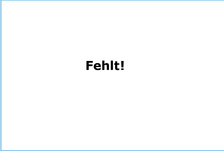
Figura : tubo para la compuerta de estrangulación en un versión similar