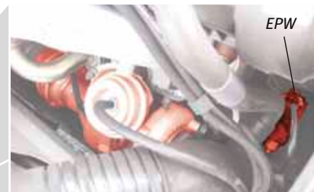
Пример: турбонагнетатель с переменной геометрией турбины и EPW (выделены красным цветом) в Audi A4 TDI

Сохраняем за собой право на внесение изменений и на отклонения в иллюстрациях. Назначение и замену см. действующие каталоги, компакт-диски TecDoc или же системы, базирующиеся на данных TecDoc.