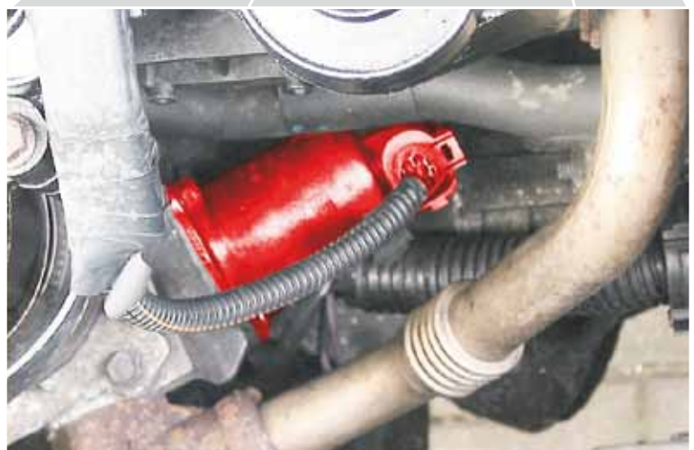
Válvula EGR no Renault Master JD1M (em destaque)