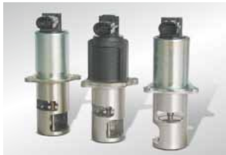
Vista del producto (extracto)

Las válvulas eléctricas de recirculación de los gases de escape (EGR) montadas están pegadas por efecto de sedimentos aceitosos.