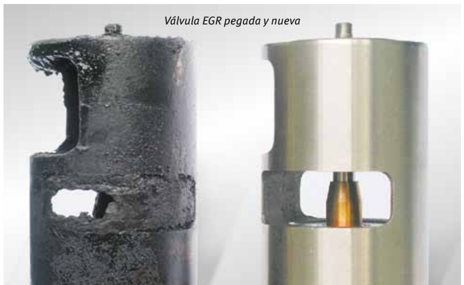
Válvula EGR pegada y nueva