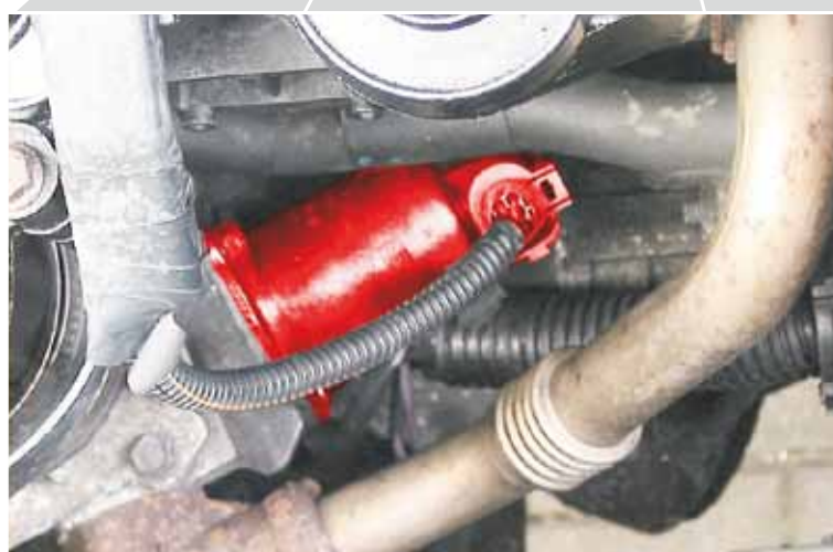
Soupape EGR dans Renault Master JD1M (mis en valeur)