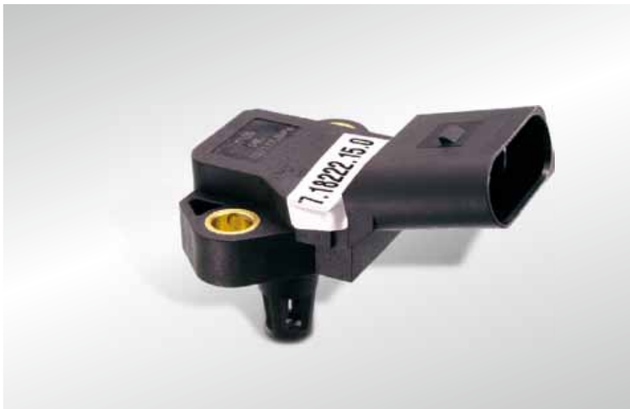
Рис. 1 Сенсор давления во впускной трубе/сенсор MAP (MAP = Manifold Air Pressure)