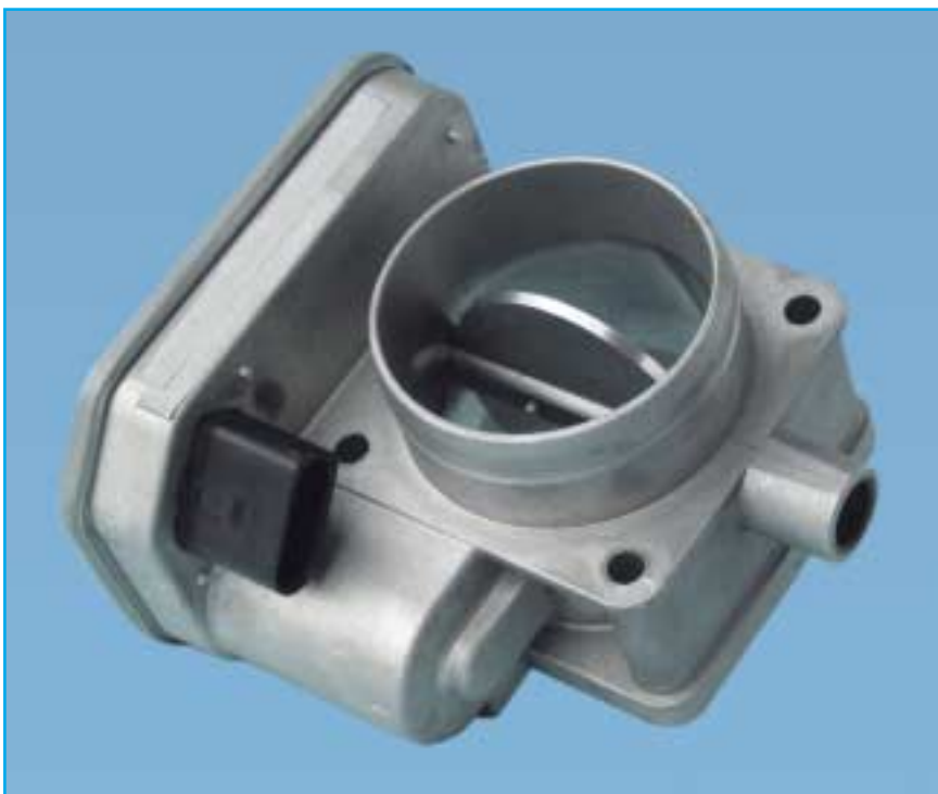
Elektromotorische Regelklappe EDR-Di

Änderungen und Bildabweichungen vorbehalten.