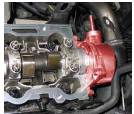
Вакуумный насос и распределительный вал в Opel Vectra B (подчеркнуто)