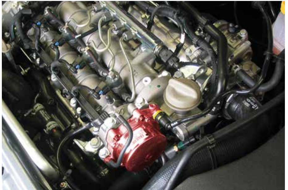
Вакуумный насос в Opel Vectra B (подчеркнуто)

Так как из-за выхода усилителя тормозного привода из строя может возникнуть опасная ситуация, вакуумный насос применяют в качестве предохранительного устройства.