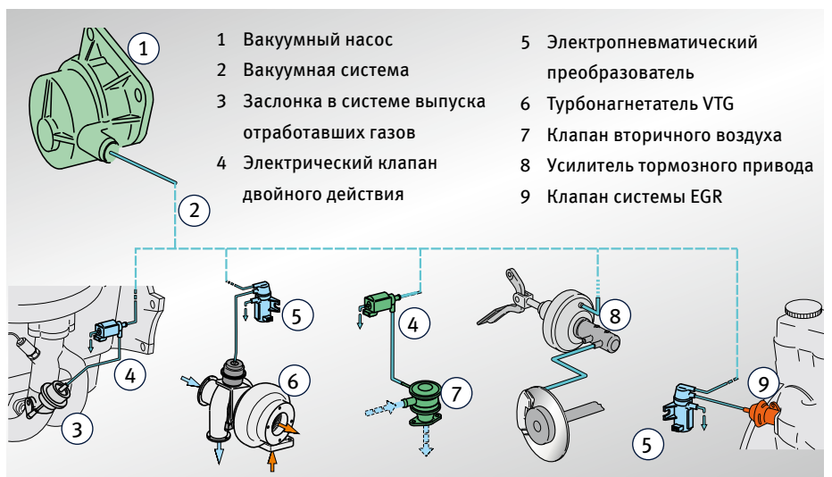
Вакуумные насосы: Области применения (выборочно)

Сохраняем за собой право на внесение изменений и на отклонения в иллюстрациях.