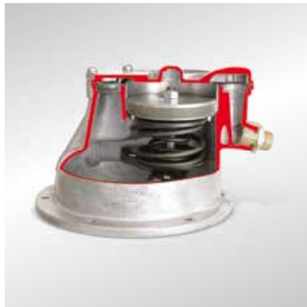
Классический поршневой вакуумный насос (модель в разрезе)

Новая тенденция заключается в сочетании насосов подачи для различных сред (двойные насосы): Комбинированные топливные/вакуумные насосы устанавливаются на одной оси с распределительным валом. Комбинированные вакуумные/масляные насосы монтируются в масляном поддоне.