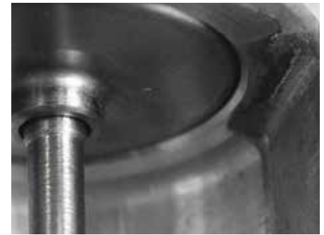
Рис. 3: Негерметичное седло клапана (указано стрелкой) влечет за собой проблемы.

Если, как показано на рис. 4, головка клапана будет заменена простым диском, то герметичность больше не обеспечивается. Будет происходить бесконтрольная рециркуляция выхлопного газа. Возможные последствия: неплавный холостой ход, недостаточное ускорение или даже аварийный ход.