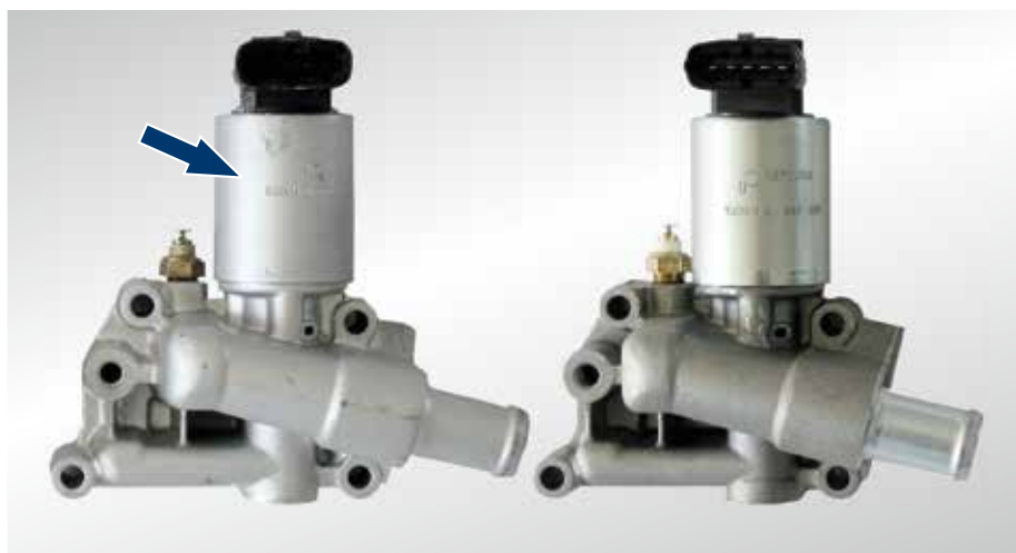
Рис. 1: Лакированный клапан системы EGR (указан стрелкой) похож на новый — но он не новый.

Как правило, обрабатывают детали более старой серии моделей. Это означает, что в продукте не учтены технические новшества.