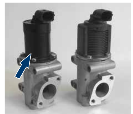
Рис. 5: Оригинальный корпус катушки был заменен простой обточенной деталью (указана стрелкой).

Мы не предоставляем гарантии на части, обработанные третьими лицами, даже если первоначально они были изготовлены компанией PIERBURG.