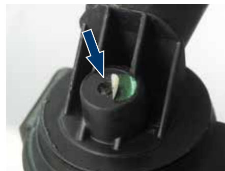
Рис. 2: Это отверстие (указано стрелкой) может привести к проникновению воды и выходу из строя.

Рис. 2: Во время обработки в корпусе катушки просверливают отверстие, внутренние части катушки выдавливают и очищают. Затем после сборки отверстие заклеивают и закрывают наклейкой. При выдавливании возможно повреждение катушки и сердечника. Через отверстие может проникнуть вода и привести к дефектам.