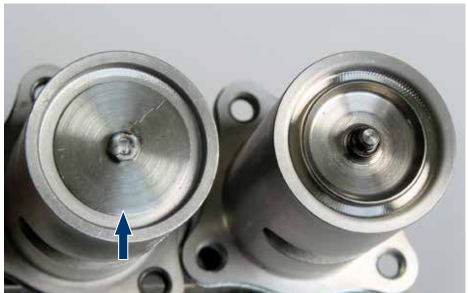
Рис. 4: Приваренный диск из листового металла (указан стрелкой) не способен заменить седло клапана.

Если, как показано на рис. 4, головка клапана будет заменена простым диском, то герметичность больше не обеспечивается. Будет происходить бесконтрольная рециркуляция выхлопного газа. Возможные последствия: неплавный холостой ход, недостаточное ускорение или даже аварийный ход.