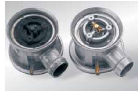
Geopende secundaireluchtklep links: schade door uitlaatgascondensaat rechts: Nieuwe toestand