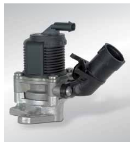
Elektrische secundaireluchtclep (sinds ca. 2007)