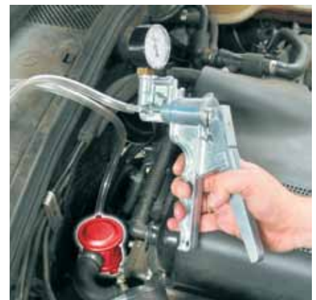
Controle van een secundaireluchtklep met een onderdruphandpomp