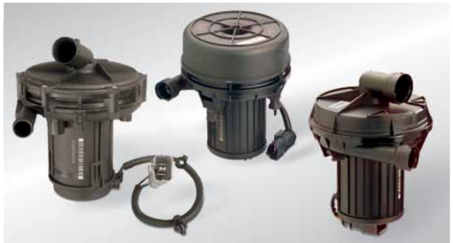
Verschillende secundaireluchtpompen van generatie 1 en 2

Ter bewaking door de On-Board-Diagnose (OBD) kunnen elektrische secundaireluchtcleppen van een geïntegreerde druksensor zijn voorzien.