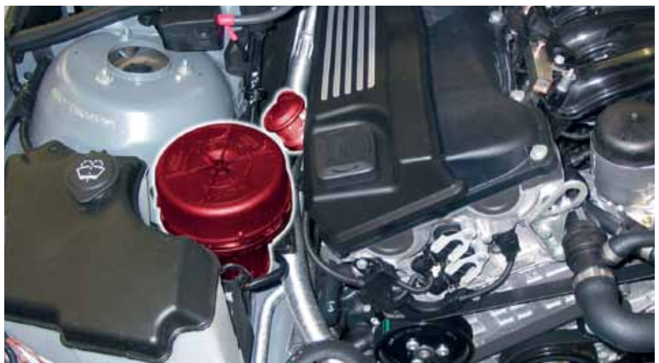
Secundairelucht klep en secundaireluchtpomp in de BMW E46 (geaccentueerd)

Wijzigingen en afwijkingen in afbeeldingen voorbehouden. Zie voor toewijzing en vervanging de betreffende catalogi, TecDoc-CD resp. op TecDoc-Data gebaseerde systemen.