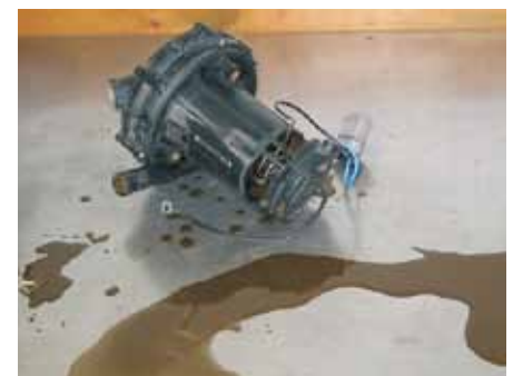
Vloeibaar uitlaatgascondensaat uit een secundaireluchtpomp