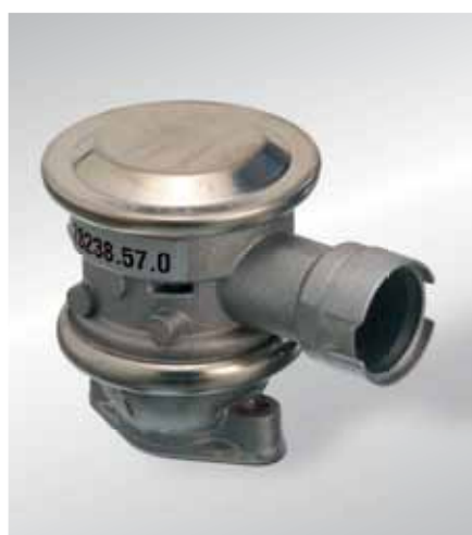
Uitschakelbare terugslagklep, drukgestuurd (sinds ca. 1998)