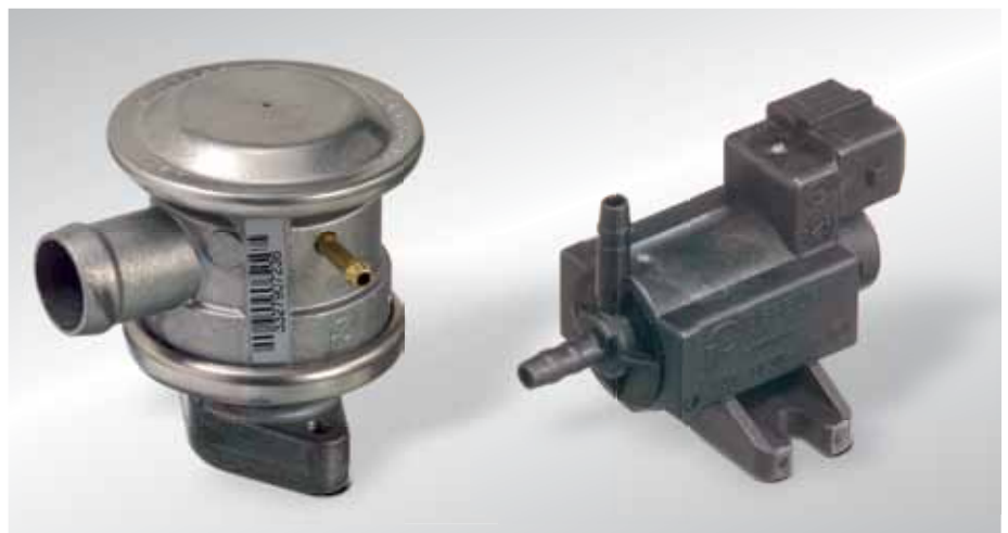
Onderdrukgestuurde uitschakel-terugslagklep (sinds ca. 1995) en elektrische omschakelklep