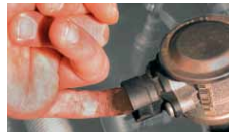
„Vingertest” aan de secundaireluchtklep in de BMW 520i (geaccentueerd) Als aan deze kant afzettingen zitten, is de terugslagklep ondicht en moet vernieuwd worden.