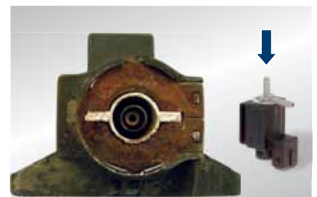
Gecorrodeerde elektrische omschakelklep (geopend)