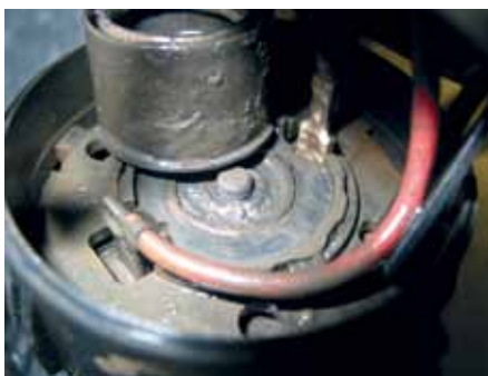
EGRESSIE uitlaatgascondensaat in aandrijfmotor van een secundaireluchtpomp

Als het aanzuigen van de secundaire lucht niet vanuit het aanzuigtraject gebeurt maar direct uit de motorruimte, dan bevindt zich een apart luchtfILTER voor de secundaireluchtpomp, die verstopt kan zijn.