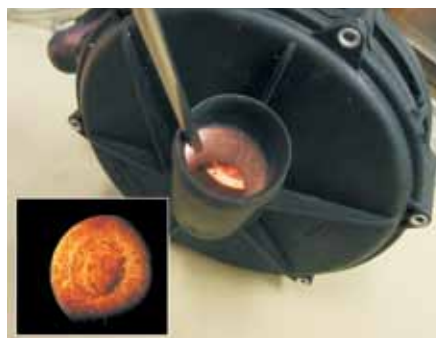
Zicht op de gecorrodeerde inlaat van een secundaireluchtpomp